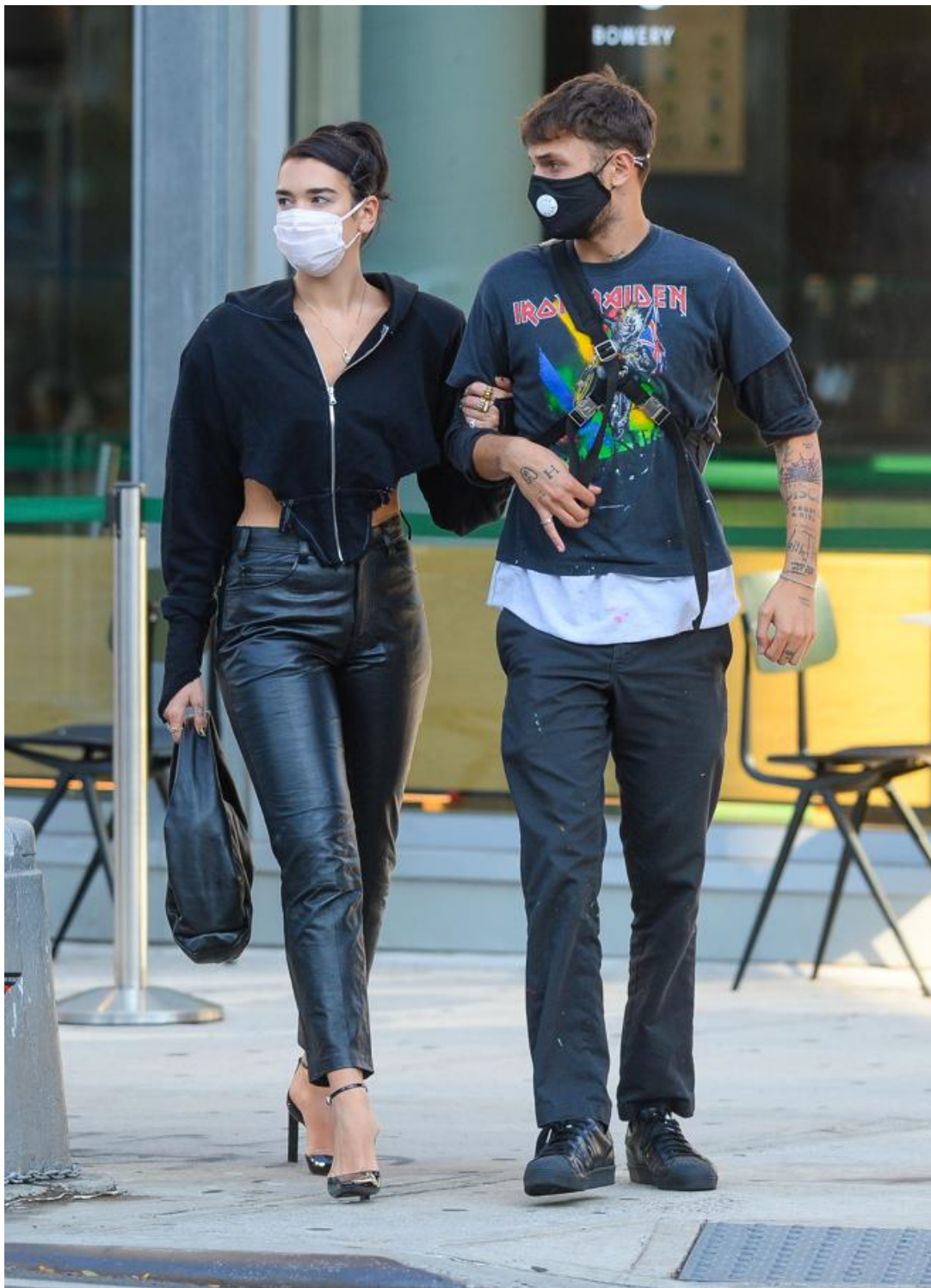
Dua Lipa

Un conjunto original que sin embargo es fácil de imitar. La hermana pequeña de H&M, la firma Arket, dispone de un bolso del estilo del que luce Dua Lipa, así como de unos pantalones de cuero en negro tobilleros y de pata ancha.