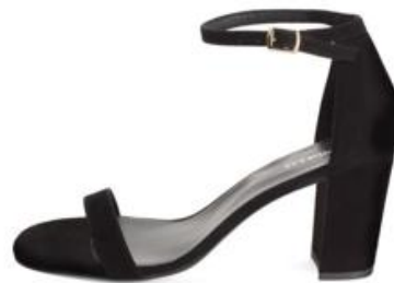
Dua Lipa look (LVD)

El resto de artículos, como la sudadera, puede adquirirse en cualquier tienda online y las sandalias, en la firma Andreas.