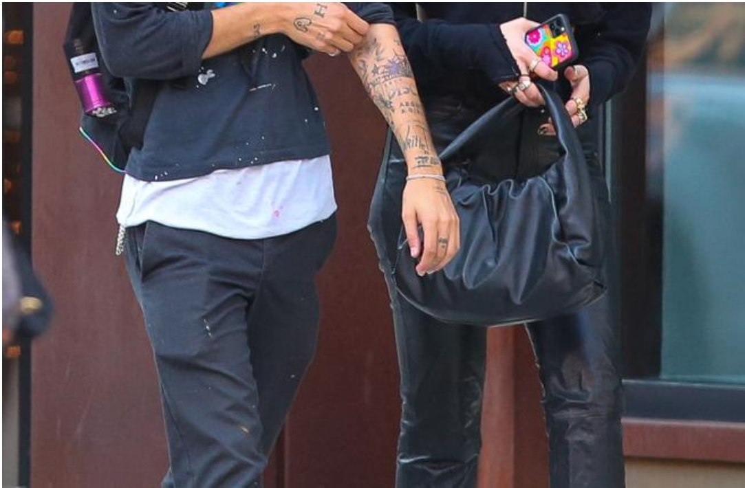
Dua Lipa