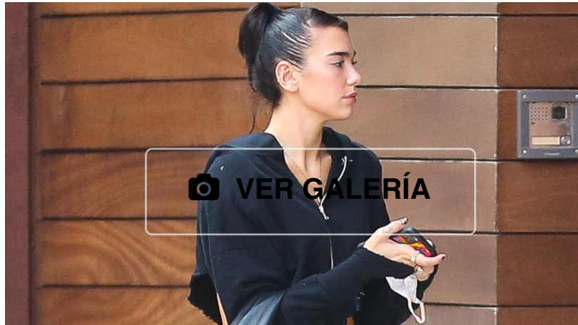
Dua Lipa

La cantante ha apostado todo al negro para pasear junto a su novio por las calles de Nueva York