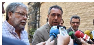
Pie de foto Sueldos y alcaldes: la ley Montoro no zanja la polémica

Las diferencias persisten pese a que se ajustan al tope legal Toscano cobra más que el alcalde de la capital