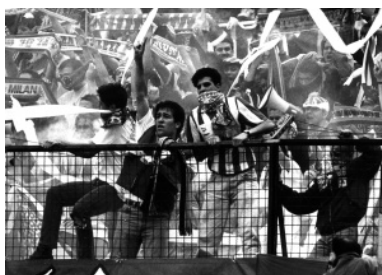
Integrantes del Frente Atlético, en un derbi de 1991 contra el Madrid.