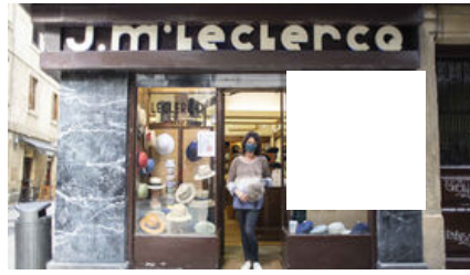
El recorrido por los rótulos de San Sebastián: 250 euros si están en euskera y ningún euro si sólo están en castellano