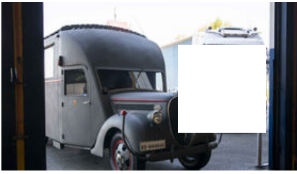
El Cuetu, el museo de la Guerra Civil que ya tiene el camión comedor en el que Franco iba a las batallas