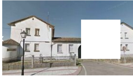
Los 12 cuarteles que la Guardia Civil ha puesto a la venta en su 'portal inmobiliario'