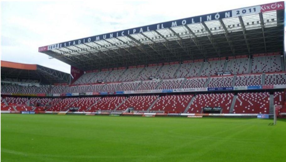
Estadio El Molinón