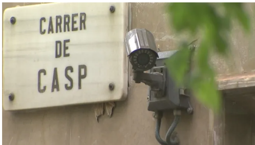
Una càmera al carrer Casp de Barcelona, on hi va haver un dels homicidis

I altres objectes que hi ha indicis que el jutge i els Mossos vinculen a l'ara detingut , com uns guants negres sense dits o un patinet platejat amb rodes roges. I també han trobat a la caravana, per tant en possessió seua, altres peces de roba amb restes biològiques -presumptament sang- que s'han portat a analitzar per si se'n pot extreure l'ADN i comparar-lo amb el de les víctimes.