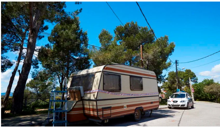
La caravana on vivia el detingut pels homicidis de diversos sensesostre